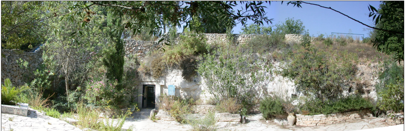
הסטיו וחזית הכניסה לחדר C. תוואי הסטיו והחצר לא ניכרים.