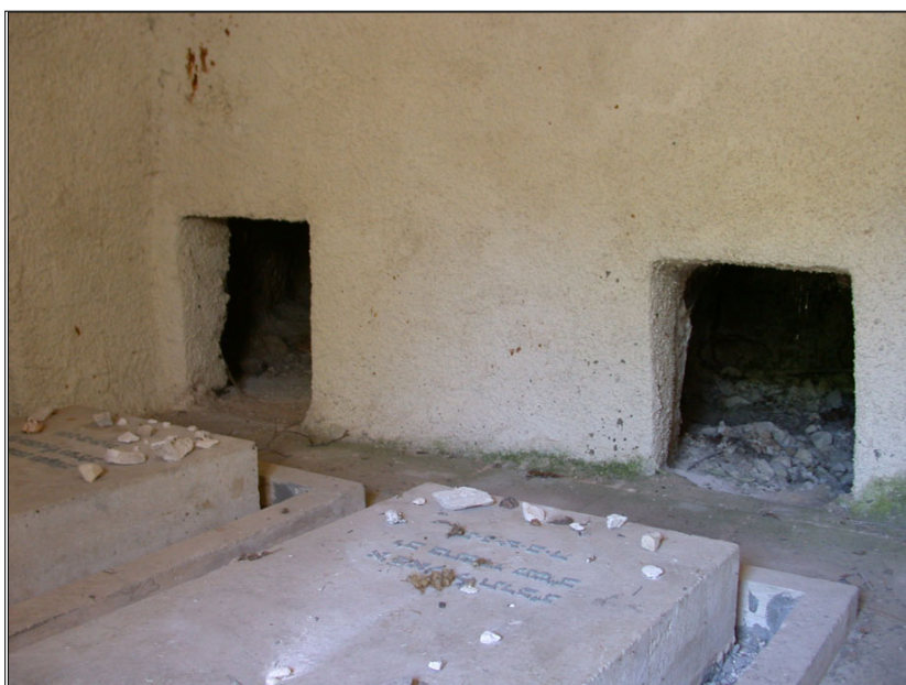
חדר C, קיר פנימי. בחזית התמונה: קברי מ. אוסישקין וי. פינסקר.

במערה קבורים יהודה פינסקר ומנחם אוסישקין.