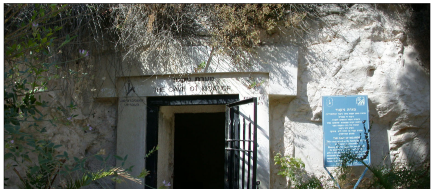
חזית חלל C.