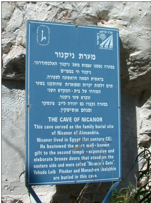
שילוט בכניסה לחלל C.