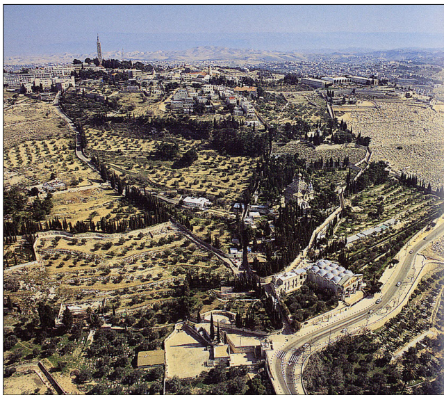
מראה כללי. מתוך: "ירושלים - מדריך לגן הארכיאולוגי"