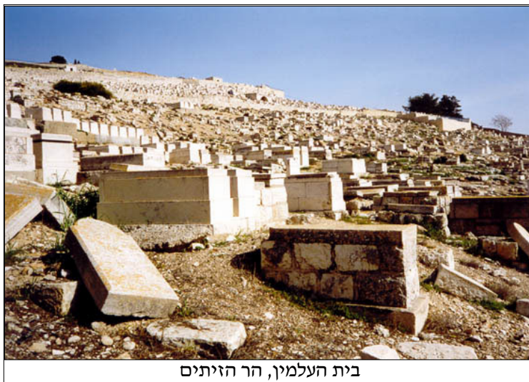
בית העלמין, הר הזיתים

היחס לאתרים נוספים בסביבה הקרובה: בהר הזיתים אתרים ארכיאולוגיים רבים, בתוכם: גת שמנים (73), קבר מרים (74), אלאונה (75), דומינוס פלויט (76), קברי הנביאים (77), כנסיית העליה (78), בית פגי (79) ועוד. במורדות ההר, סמוך לערוץ הקדרון מצויות מצבות מונומנטליות מימי בית ראשון (72), ובהמשך: כפר השילוח (82), עיר דוד (81) וכו'. ייתכנות תיירותית: גבוהה מאוד, ברמה ארצית.