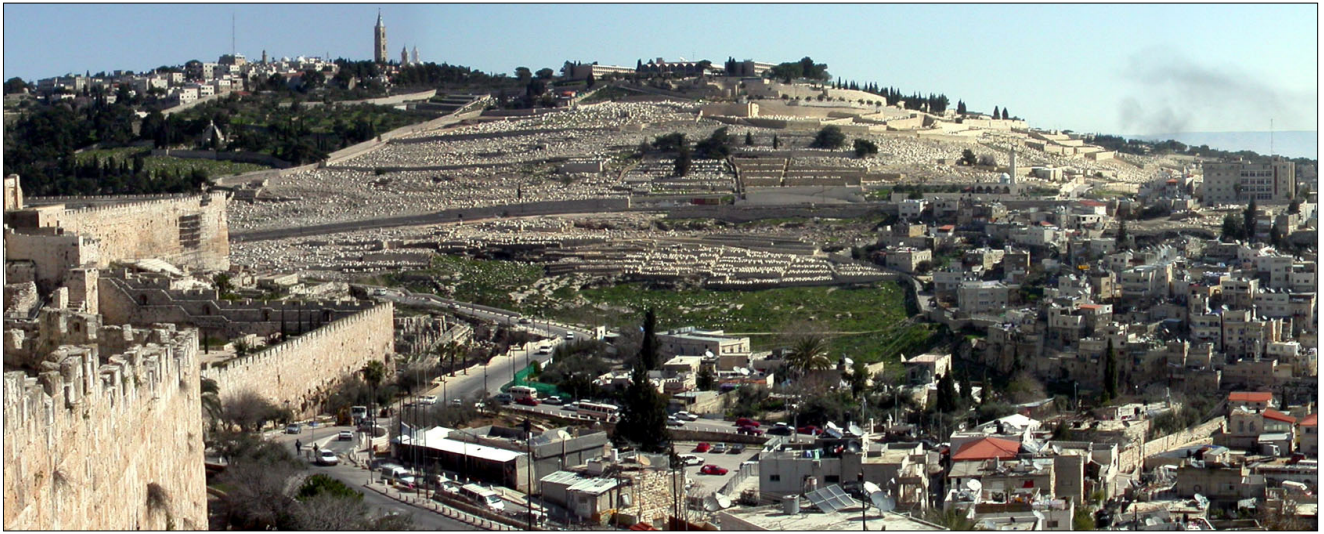
הר הזיתים : מבט על ההר מכיוון מערב