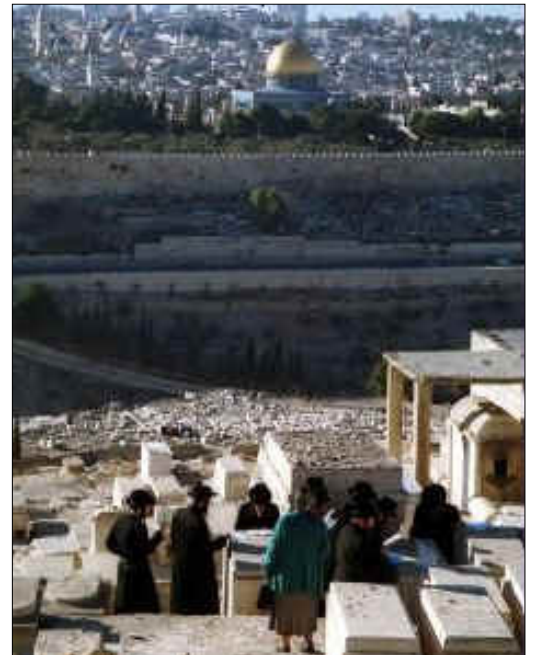
בית הקברות, הר הבית ברקע