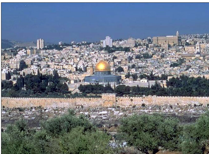
מבט על הר הבית מהר הזיתים