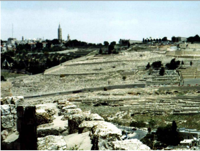
הר הזיתים, המדרון המערבי

תקופות: ברזל, הרודיאנית, רומית, ביזאנטית, ערבית, עות'מאנית רמת השתמרות: גבוהה ממצא מיוחד: פוטנציאל לחפירה עתידית: 1, 2, 3, 4, 5