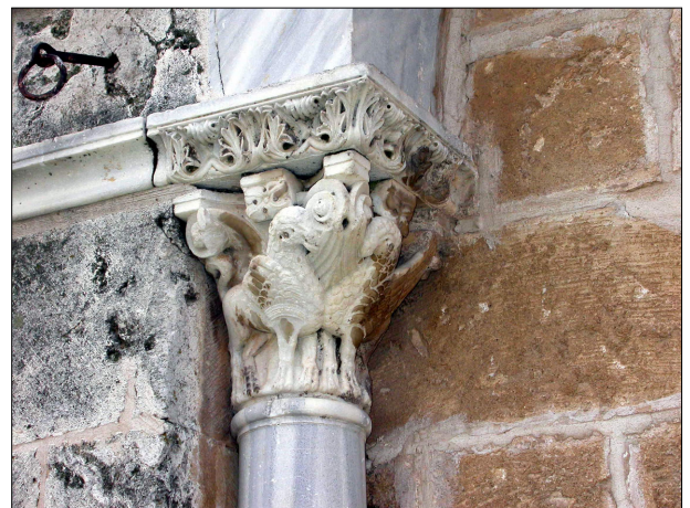
כותרות מהתקופה הצלבנית: גריפונים ועלים