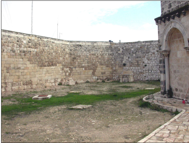
הקיר ההיקפי סביב הכנסייה