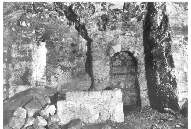
שרידים נלווים, מתוך ארכיון הצילומים, רשות העתיקות