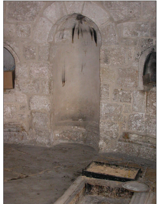
מחיראב בקיר הדרומי של המבנה