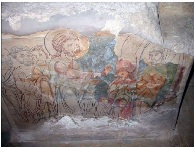
האבן המעוטרת: פרט