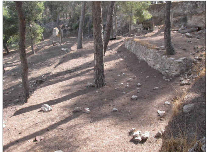
ההקשר הסביבתי: חורשה, מדרגות עיבוד