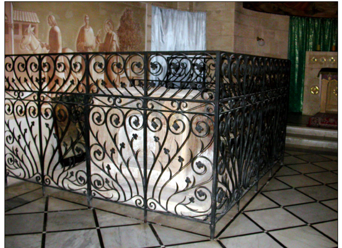
האבן המעוטרת סמוך לקיר הצפוני