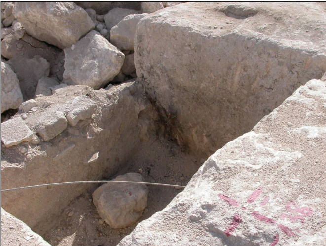
גת, בור איגום