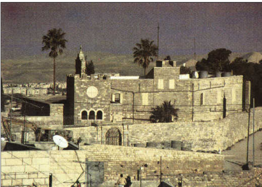
בית פגי (כנסייה)

הכנסייה החדשה, המנציחה את המסורת אודות בית פגי, נבנתה בשנת 1883 בידי הפרנציסקנים. תמשיחי הקיר (פרסקאות) מתארים את כניסת הניצחון לירושלים ואת יום הדקל המקודש. סמוך לקיר הצפוני של הכנסייה מצוייה אבן, בעזרתה על פי המסורת, עלה ישו על החמור. על האבן צוירו ציורים בתקופה הצלבנית. בשנת 1964 עוטרה האבן מחדש על בסיס הציורים העתיקים.