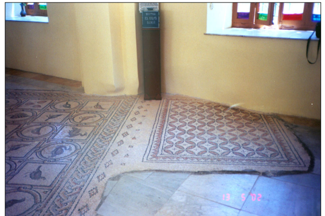
רצפת הפסיפס המשולבת בכנסייה החדשה