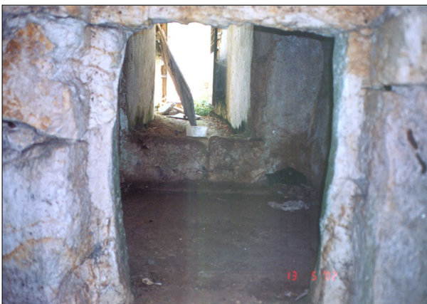
שרידי הכנסייה העתיקה