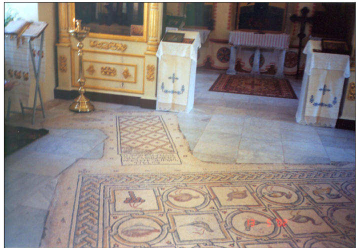
רצפת הפסיפס המשולבת בכנסייה החדשה