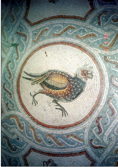
רצפת פסיפס : פרט