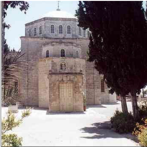
מבנה הכנסייה החדשה