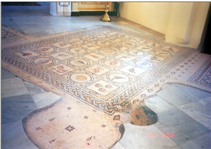
רצפת פסיפס המשולבת בכנסייה הרוסית החדשה